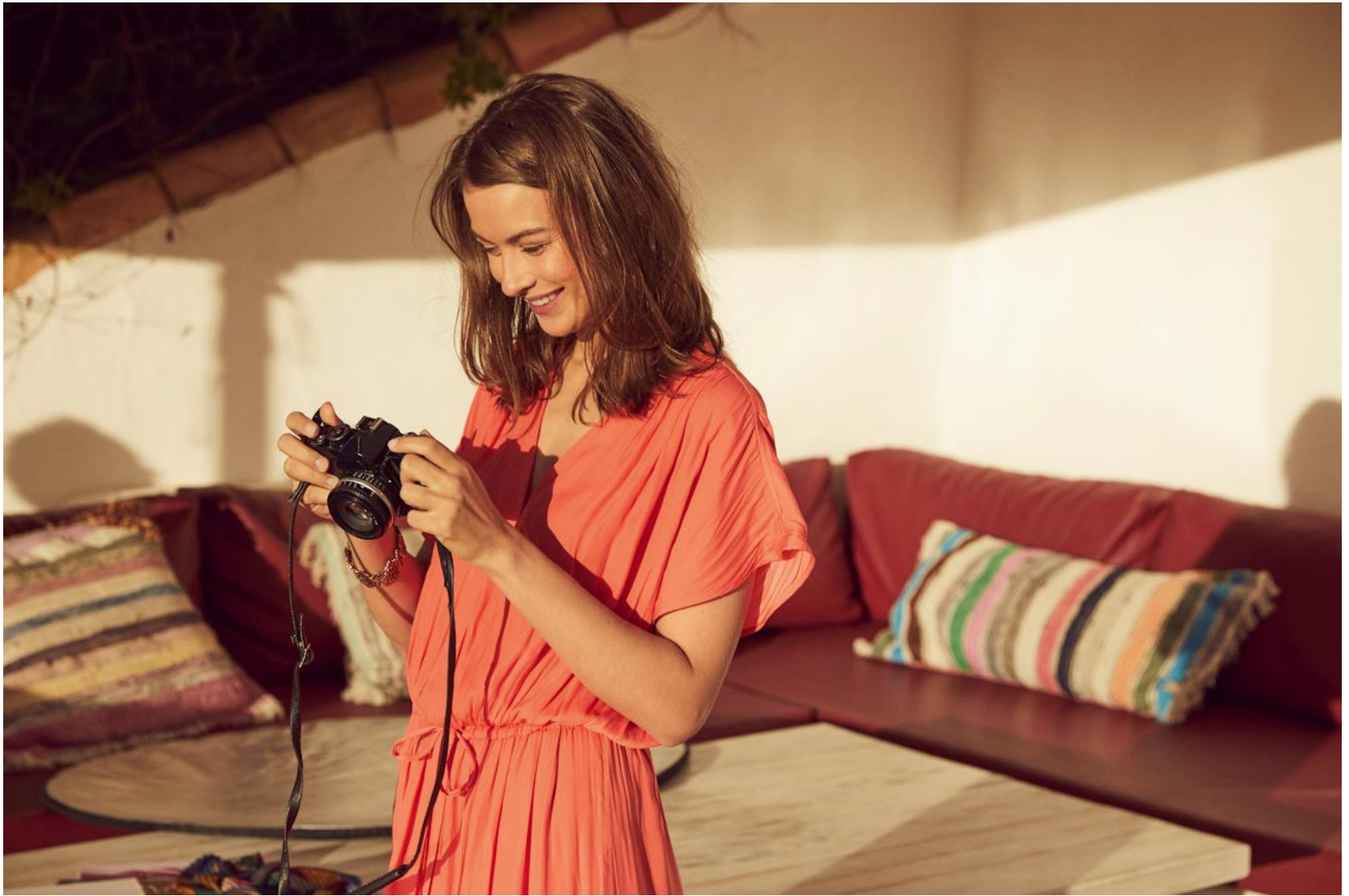
Robe longue • 39.95 €