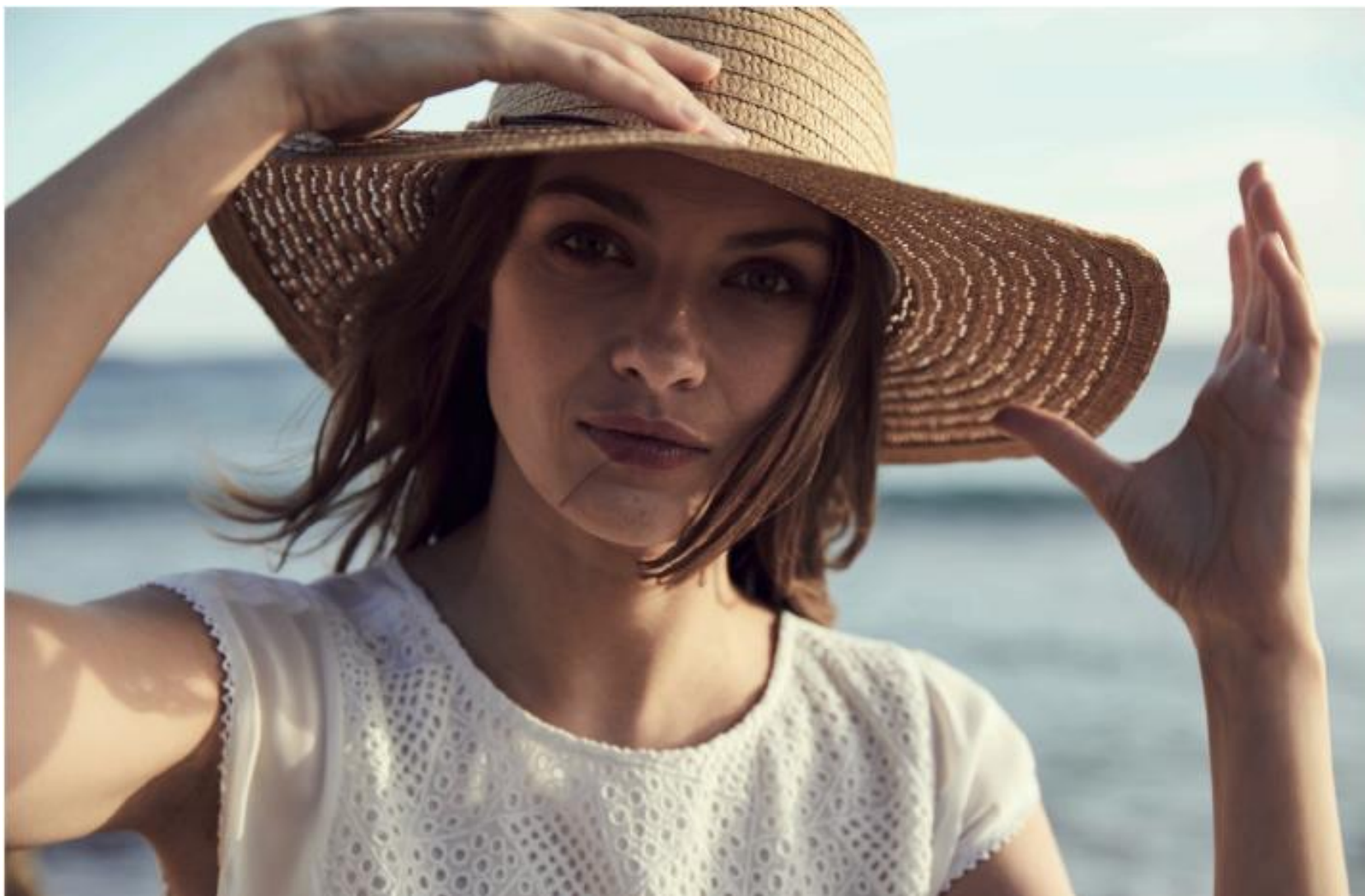
Robe brodée • 49.95 €